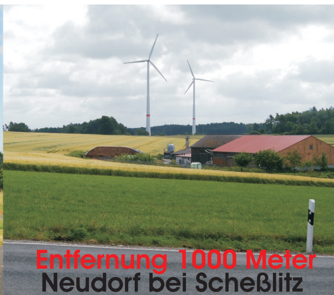
Entfernung 1000 Meter Neudorf bei Scheßlitz

“Nun könnte man sagen, das alles sei berechtigt, weil es uns unabhängig mache von fossilen Energieträgern und der Kernenergie. Und weil es dem Klimaschutz diene.”